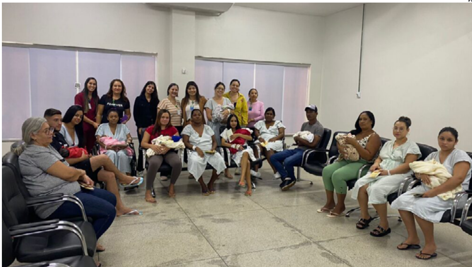
Mães tiveram a oportunidade de compartilhar experiências e desafios na roda de conversa