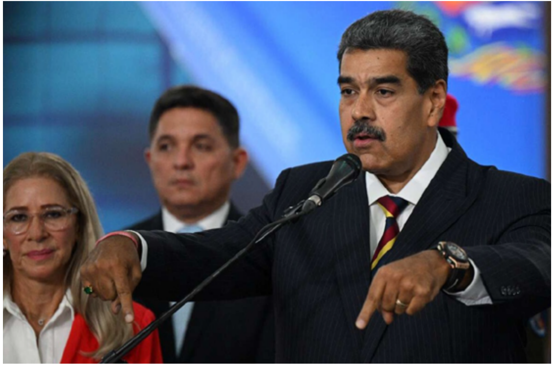
Em discurso recente, Maduro afirmou que as redes sociais contribuem para a instalação do ódio no país

Além disso, o governo venezuelano tem tomado medidas drásticas contra veículos de comunicação internacionais. Por exemplo, o jornal americano Wall Street Journal teve seu acesso bloqueado na Venezuela após publicar uma reportagem crítica ao governo. Essa ação é vista como parte de um esforço mais amplo para controlar a narrativa e limitar o acesso a informações que possam desafiar o regime de Maduro.