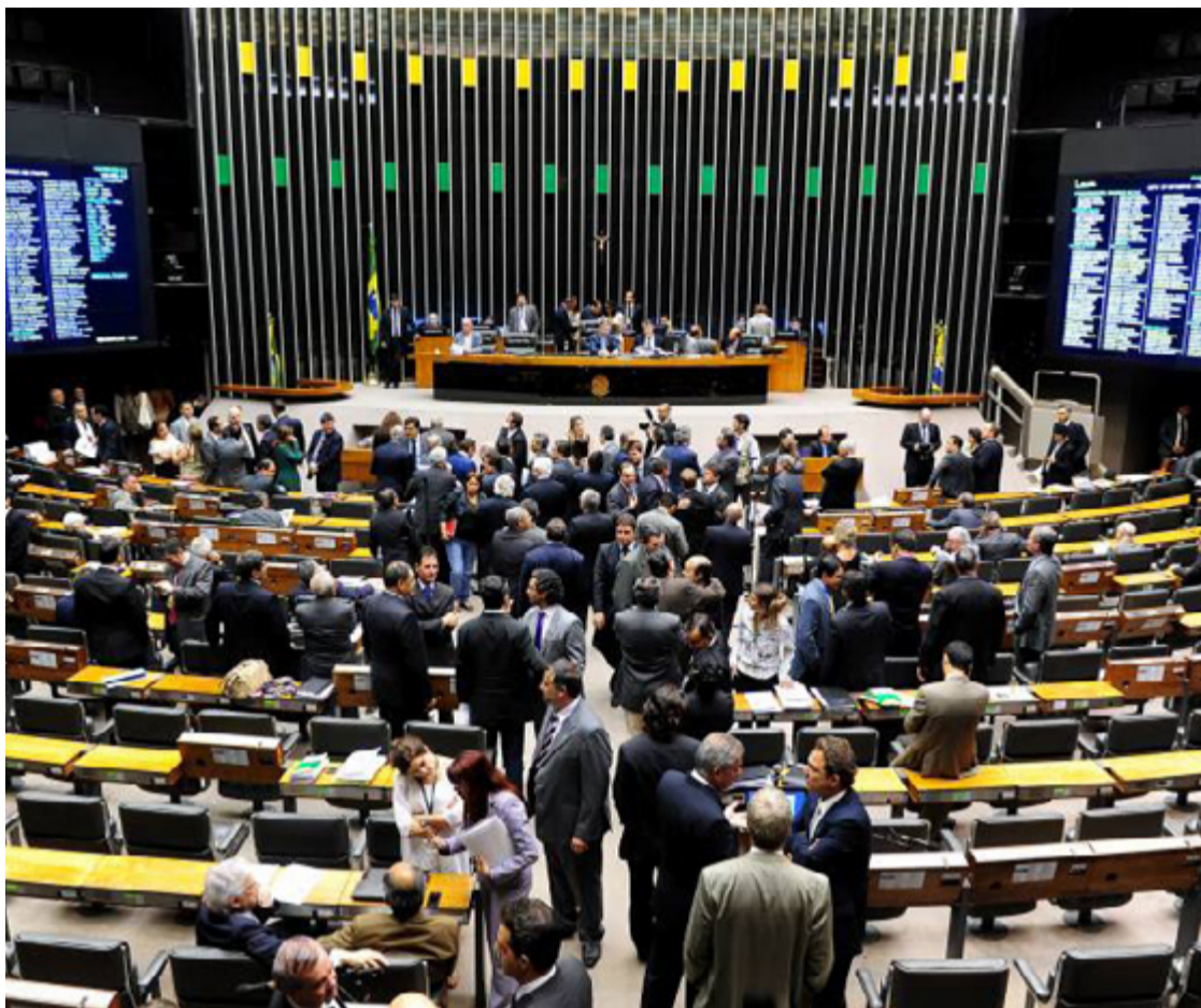
Senadores e deputados federais vão conciliar atividades em plenário com campanhas eleitorais

Padilha voltou a defender o aumento da CSLL (Contribuição Social sobre o Lucro Líquido), tributo que incide sobre o lucro das empresas, para ajudar a compensar o impacto estimado em R$ 17,2 bilhões neste ano.