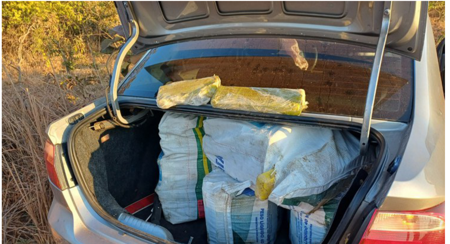
Dentro do carro, os agentes encontraram 318 tabletes de maconha, totalizando 324 quilos da droga, distribuídos entre o porta-malas e o banco traseiro

Dentro do carro, os agentes encontraram 318 tabletes