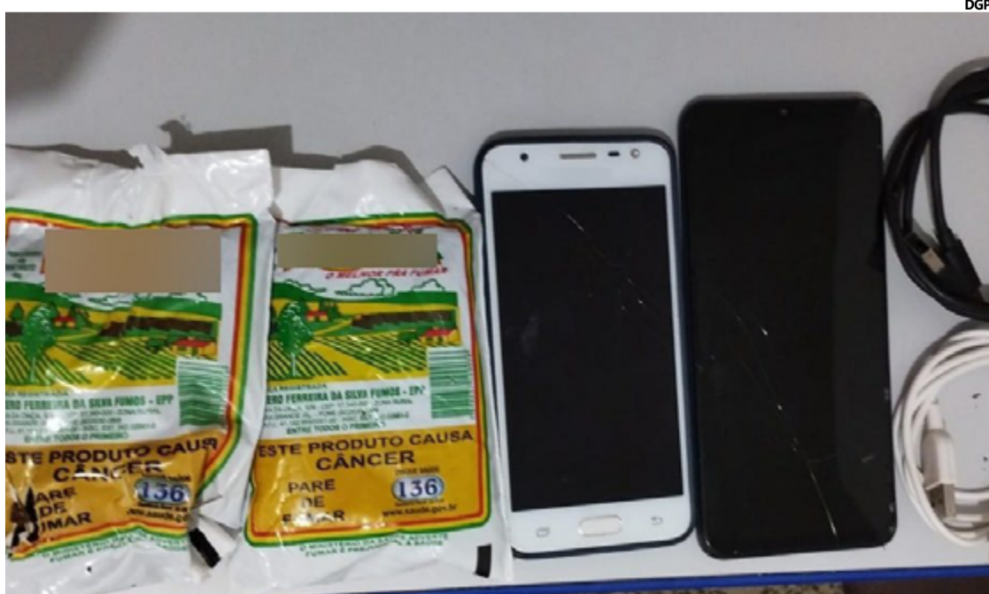
Apesar da eficácia da operação, o suspeito responsável pelo lançamento dos embrulhos não foi localizado

Os pacotes continham celulares, acessórios eletrônicos e materiais destinados à produção de cigarros, itens proibidos dentro do ambiente prisional. A ação rápida dos policiais penais evitou que os objetos chegassem às mãos dos detentos, mantendo assim a segurança e o controle dentro da instituição. Apesar da eficácia da operação, o suspeito responsável pelo lança-