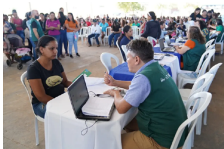
Atendimento da AGEHAB em evento do Aluguel Social: Agência alerta candidatos a benefícios contra falsos e-mails

No comunicado, havia um link para sacar o recurso imediatamente. A candidata procurou a AGEHAB e foi informada que o e-mail era falso. No sistema constava que ela ainda não tinha sido contemplada. "Se receber qualquer e-mail como se fosse da AGEHAB, jamais clique no