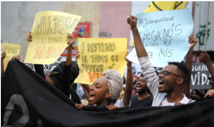
Maioria das vítimas era negra, homem e tinha de 15 a 19 anos

Foram registradas 4.803 mortes violentas intencionais de crianças e adolescentes em 2021, 5.354 em 2022 e 4.944 em 2023