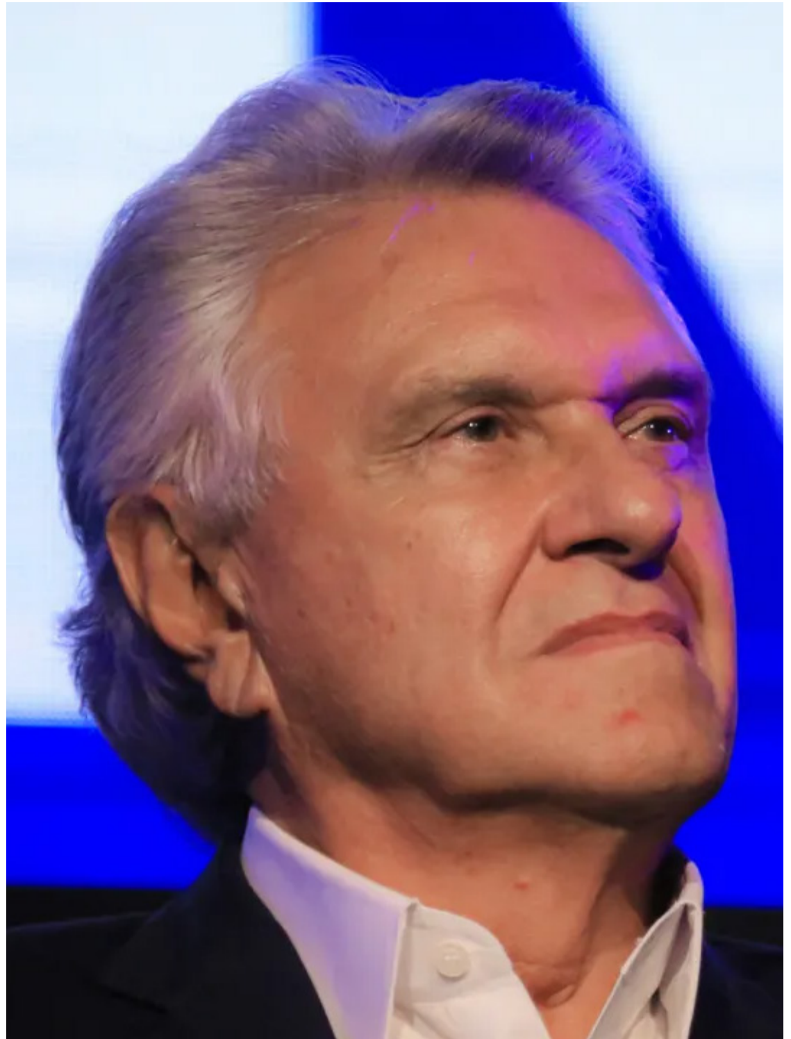
Ronaldo Caiado: falta diálogo do Governo Lula com os governadores

Além das críticas à reforma tributária, Caiado também apontou problemas no sistema de emendas parlamentares impositivas, que têm ocupado uma fatia crescente do Orçamento Público. De acordo com