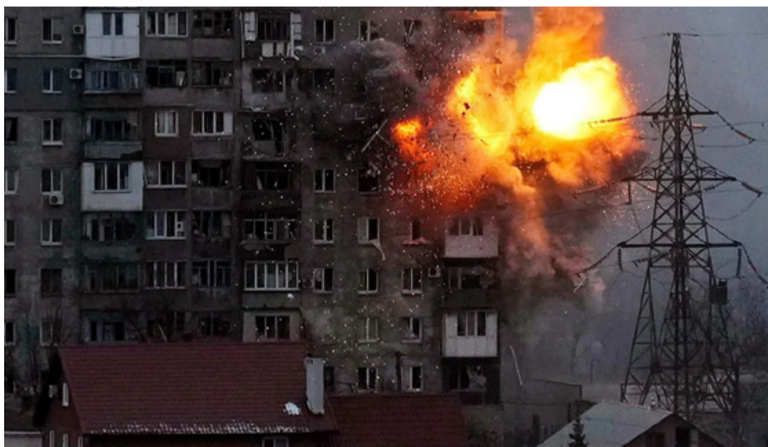
Mstyslav Chernov esteve durante 20 dias sitiado em cidade ucraniana