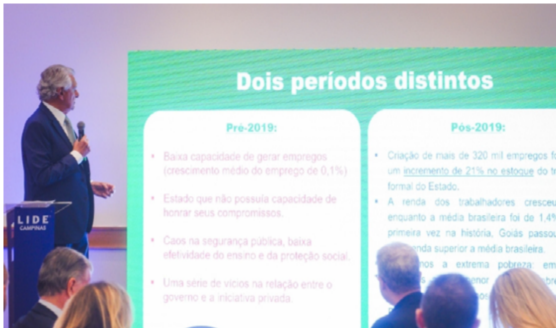
Governador Ronaldo Caiado avalia cenário econômico: segurança jurídica impacta Goiás

A plateia, composta por empresários dos setores de saúde, agronegócio, indústria farmacêutica, educação, comércio, jurídico, automotivo,