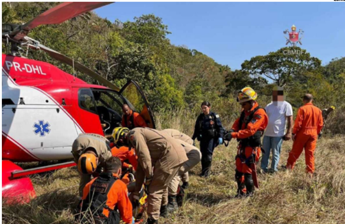
Segundo o CBMDF, a jovem estava consciente e orientada no momento em que os socorristas chegaram ao local

De acordo com o CBMDF, a jovem estava consciente e