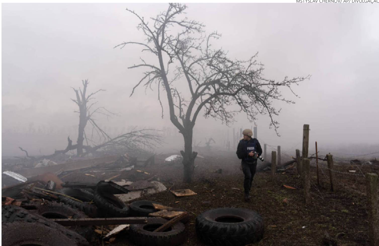
Doc traz pensamentos do repórter entrelaçados às imagens da destruição