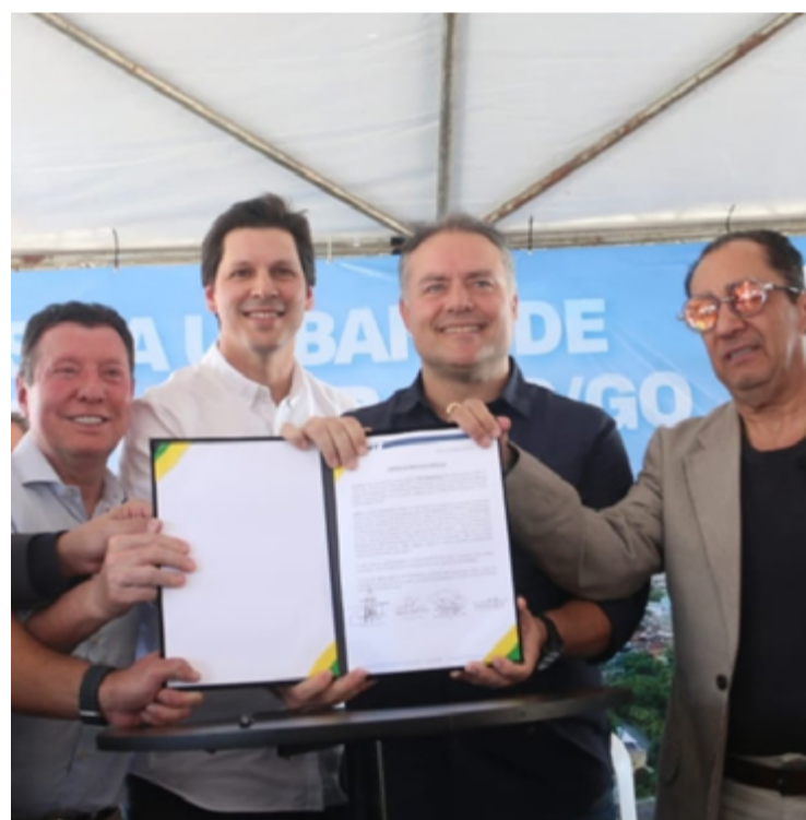
Vice-governador Daniel Vilela e Renan Filho: assinatura de ordem de serviço para obras rodoviárias no trecho urbano da BR-020

A construção dos viadutos teve início em 2020 e foi paralisada em 2022. O ministro Renan Filho assegura que, desta vez, não haverá interrupções. “O projeto-executivo já foi finalizado; as obras serão retomadas imediatamente”, afirmou.