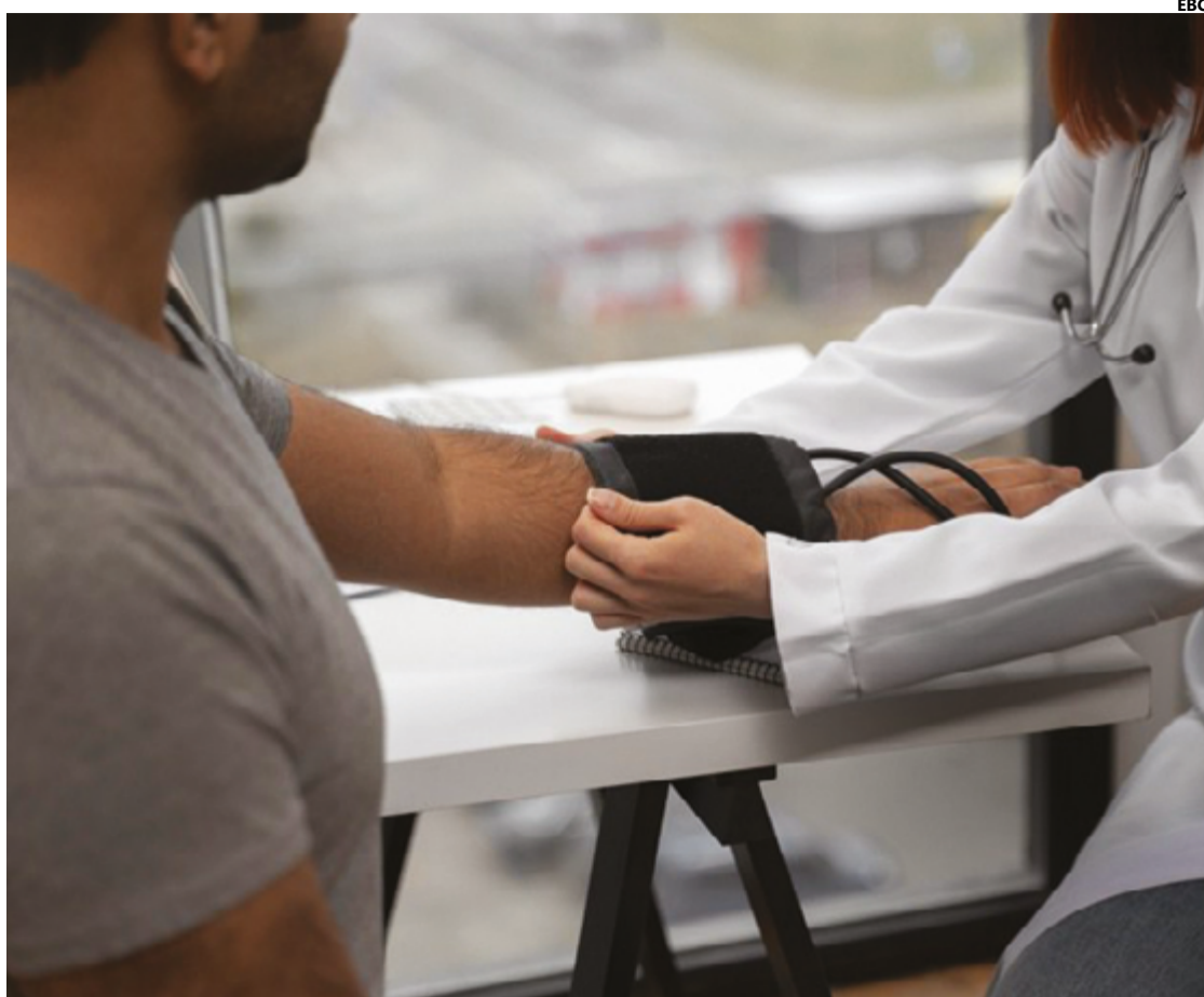
Colesterol alto é um dos principais fatores que aumentam o risco de desenvolvimento de doenças cardiovasculares