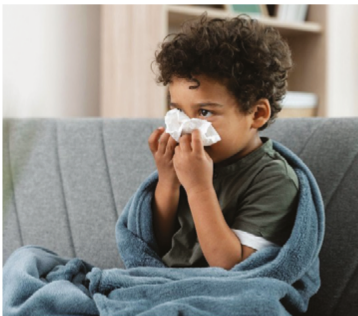
Sintomas incluem febre alta, dor de cabeça, dores musculares, tosse e dor de garganta; crianças e idosos são mais suscetíveis à doença

A automedicação em casos de gripe é perigosa e pode agravar a condição do paciente. O uso indiscriminado de medicamentos, como antibióticos, que não são eficazes contra vírus, pode levar à resistência bacteriana e a efeitos colaterais desnecessários. Além disso, medicamentos para aliviar os sintomas da gripe, como analgésicos e antitérmicos, devem ser usados com cautela e sob orientação médica para evitar complicações. Procurar orientação médica ao apresentar sintomas gripais é essencial para um diagnóstico adequado e um tratamento eficaz. Na dúvida, o ideal é sempre buscar o serviço de saúde mais próximo.