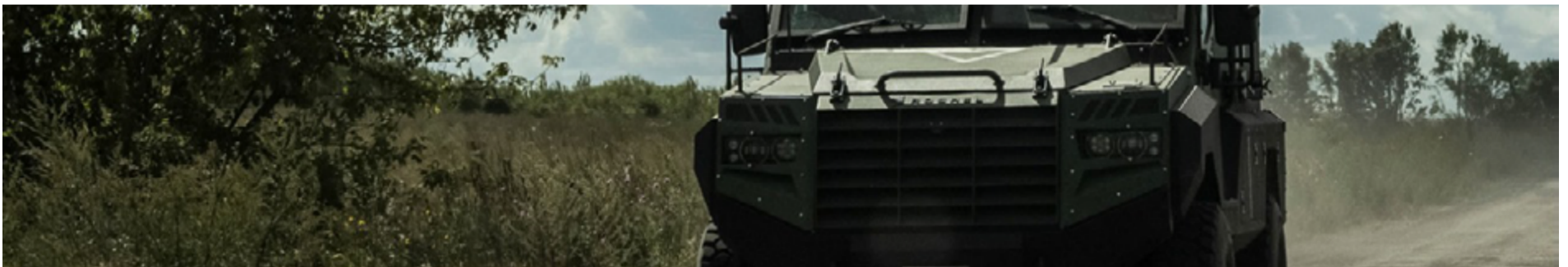
Ofensiva é a maior incursão ucraniana em território russo desde o início da invasão